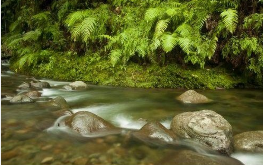
vue sur la rivière ...