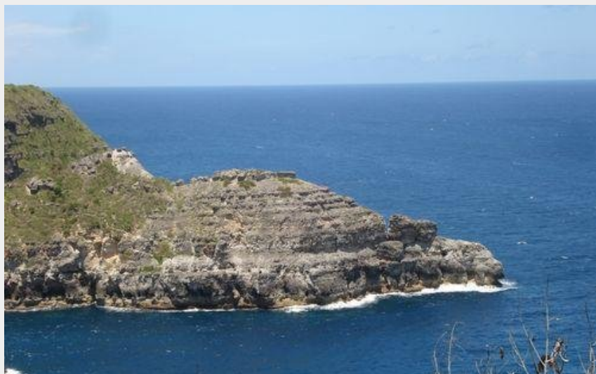
"La Tortue" (PNG)