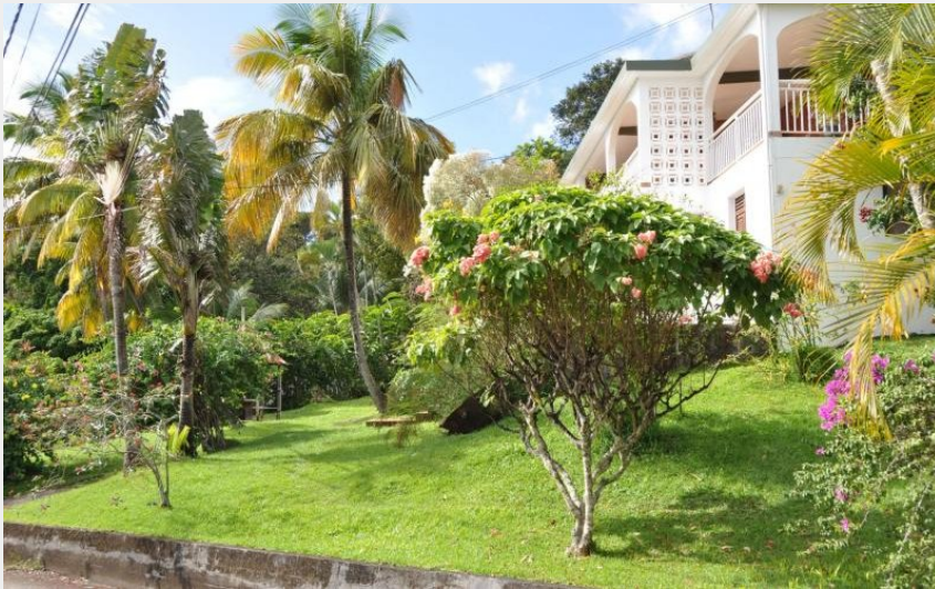
Crédit : Domaine de Vanibel (Jardin tropical du domaine de Vanibel)