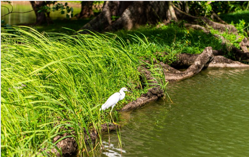
Crédit : Lara Balais - Parc national de la Guadeloupe (Parc aquacole - aigrette)