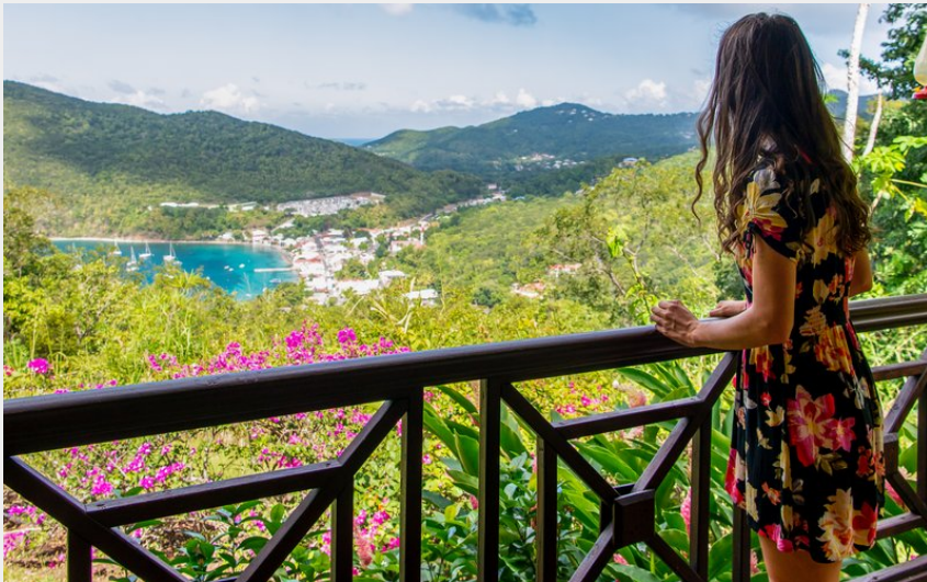
Crédit : Jardin des colibris - gîtes et lodges - terrasse (© Lara Balais - Parc national de la Guadeloupe)