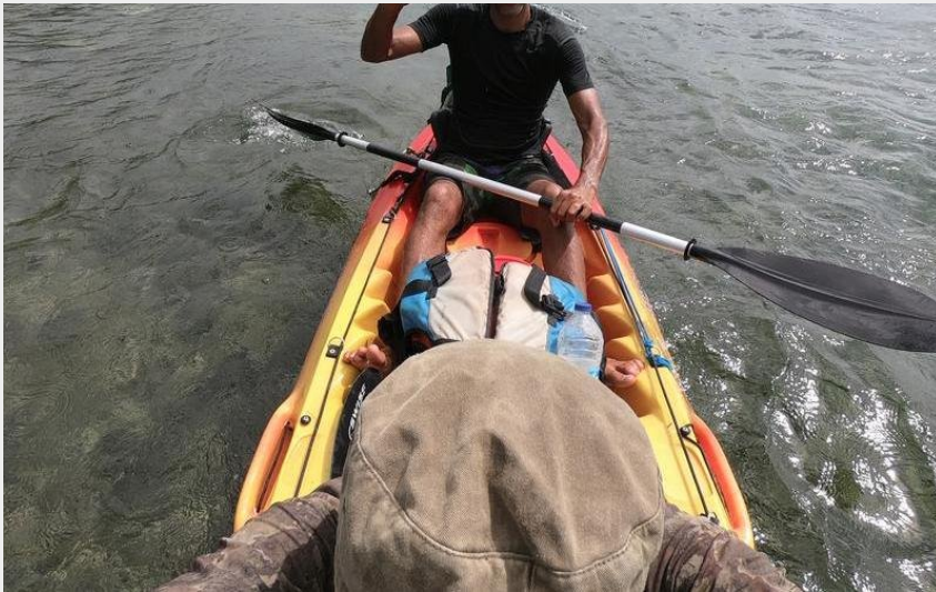
(Sortie de découverte du Grand-Cul-de Sac Marin en kayak)