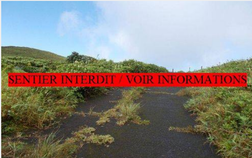
montée vers La Citerne (PNG)