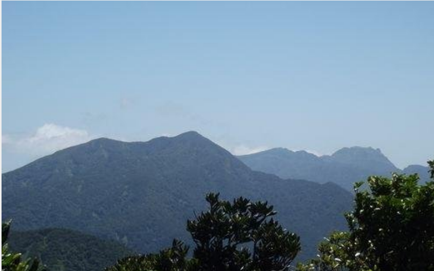
Vue depuis le Piton de Bouillante